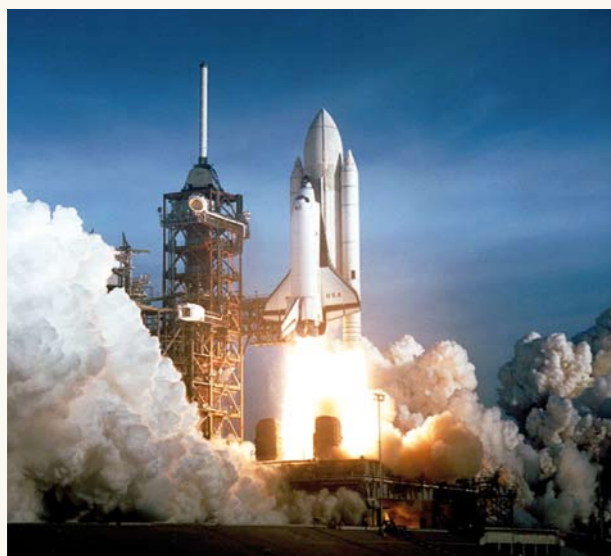
Spaceshuttle Columbia beim Erstflug 1981

Wenn du in einer eigenen Arbeit fremde Texte, Bilder und Töne verwendest, sei dies aus Büchern, Zeitschriften, von CDs oder aus dem Internet, dann musst du immer angeben, woher sie stammen. Man nennt dies eine Quellenangabe.