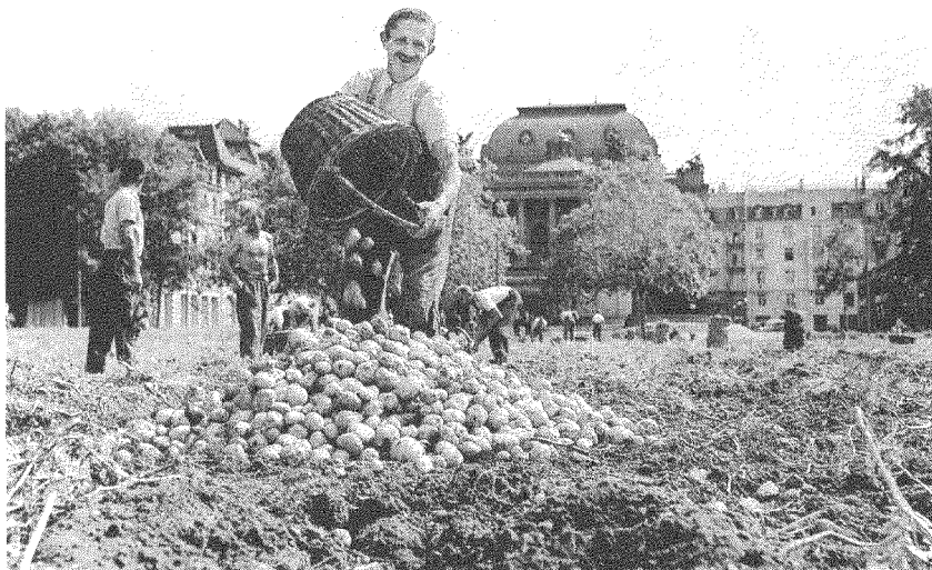
Anbauschlacht: Kartoffelernte 1942 auf der Sechseläutenwiese.

B. Bonhage, P. Gautschi, J. Hodel, G. Spuhler: Hinschauen und Nachfragen – Die Schweiz und die Zeit des Nationalsozialismus im Licht aktueller Fragen. Lehrmittelverlag des Kantons Zürich. 150 S., Schulpreis 24 Fr., Ladenpreis 37 Fr.